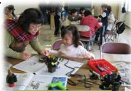
クリスマス小物作り