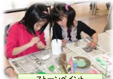
ストーンペイント

・木の枝や木の実、まつぼっくりなどを使って作品を作ったり、時計などを作ったりします。