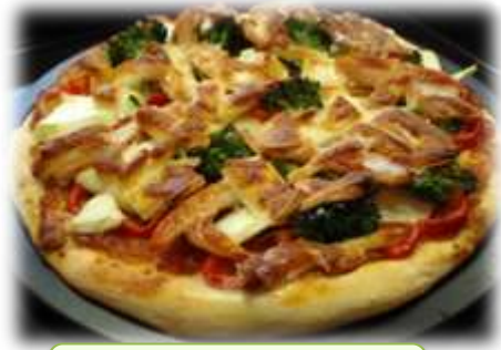
地域の食材を使った ピザづくり

・中頓別では、四季折々に中頓別ならではの食材が楽しめます。春は山菜、夏にはハチミツやチーズ、秋にはキノコやヤーコン、キクイモなどの野菜を食べることができます。新鮮な食材を使ってピザ作りなどを体験しませんか？