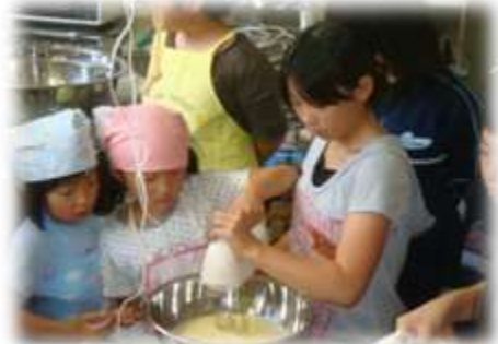
アイスクリーム作り

・地域の炭焼き窯を使って、炭作りが体験できます。 ・炭作りは、木入れ作業から窯出し作業まで10日程度かかりますが、体験する内容や所要時間については、ご相談ください。