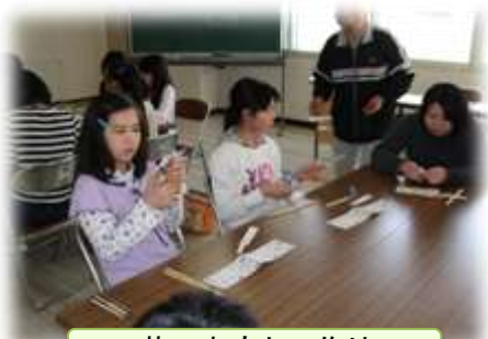
昔のおもちゃ作り