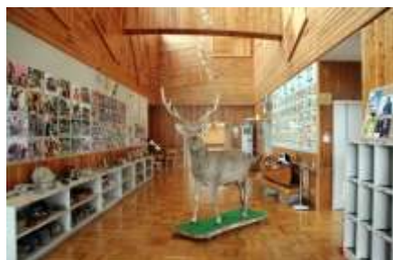
化石等を展示しています