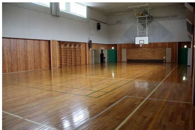
バスケットコート 1 面分の体育館。