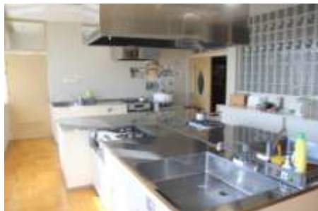
シンク×3、ガスコンロ×3